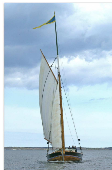
Sandkilen Helmi från Blidö

Båt&Byggnadsvård i Roslagen Gamla Väsbyvägen 5 761 97 Norrtälje