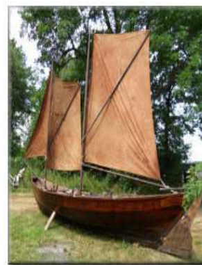
Skötbåten Emvika från Rådmansö